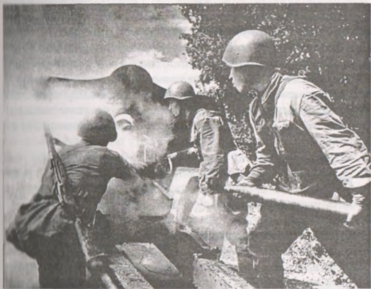
Артиллеристы ведут огонь

трое детей от шести до девяти лет. Они упали в траншею, а их сверху накрыл своим телом какой-то капитан. И когда кончилась бомбёжка, то оказалось, что капитан мёртв, а рядом с ним – солдат с разорванным животом, кишки которого лежали на земле, и он молил всех не о помощи, а чтобы его пристрелили, но этого никто не мог сделать. Дети остались живы. Вот так и было на войне: сам погибай, а товарища выручай! И штурчали! Своей жизнью спасали друзей боевых. Поэтому и побеждали.